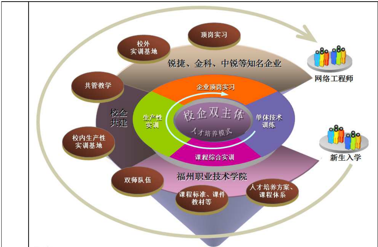
图1 校企双主体实施现代学徒制人才培养

同时学校和企业从两种不同的教育环境和教育资源，突破体制与机制上的瓶颈，各司其职，各负其责，各专所长，分工合作，共同完成对学生（员工）的培养。培养方案要体现五个对接；